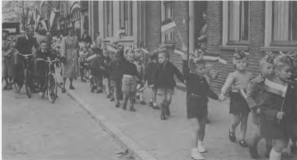
Een feestelijke optocht in de Marktstraat uit oktober 1955 (iedereen in korte broek!) toen school D, geheel gerestaureerd, als nieuwe kleuterschool in gebruik werd genomen. Via de Werkgroep Gesproken Geschiedenis kreeg de HVW onlangs de beschikking over enkele bijzondere foto- en knipselalbums. De schenking is gedaan door Fina Woud-Mastrandrea en deze foto is afkomstig uit het album van haar moeder, de welbekende "juf" Bruinsma.

We vallen meteen maar met de deur in huis: mogelijkerwijs staat uw schenking niet vermeld in onderstaande opsomming. We zijn namelijk nog niet klaar met de registratie van alle stukken en de ruimte in deze nieuwsbrief is op dit moment te beperkt om de vele binnengekomen schenkingen, vooral na de succesvolle jaardag, te vermelden. In ieder geval een duidelijk teken dat men de weg naar de HVW weet te vinden en daar zijn we heel blij mee. Dus als uw gift niet voorkomt, dan nog eventjes geduld graag. Met name hebben we veel bijzondere zaken gekregen van Piet Stelling, Dick Zwart en Fina Woud - Mastrandrea. In de volgende nieuwsbrief zullen we daarover wat uitgebreider berichten en ook wat meer