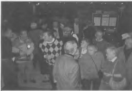
drukte tijdens HVW jaardag