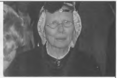
De Zaanse Kaper showde authentieke Zaanse rouwkleeding