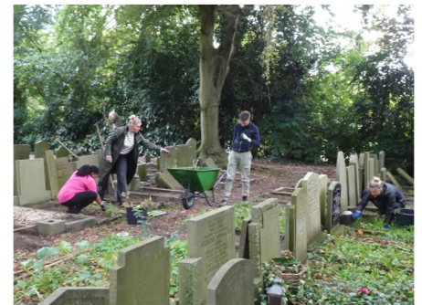
Gemeente-ambtenaren hard aan het werk

er daardoor deze winter aan toe het een en ander aan beplanting te gaan doen. Maandagochtendhulp blijft uiterst gewenst, dus mocht u er zin in hebben, vanaf 9.00 uur bent u welkom! Eindtijd mag u zelf beslissen.