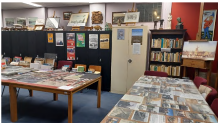
een professionele tentoonstelling

Tijdens de Open Monumentendagen op 14 en 15 september 2024 was er in het clubhuis een tentoonstelling met als thema 'Erfgoed van routes, netwerken en verbindingen'. Op een aantal tafels waren foto's te zien van en informatie over de verbindingen van Wormerveer en Westknollendam met de omliggende gemeenten in vroeger tijden. Dat waren foto's van de oorspronkelijke paden en oversteekplaatsen, de trekschuit op het jaagpad langs de Nauernasche Vaart, het personen- en vrachtvervoer over het water (de Alkmaar Packetboot), de weg en het spoor, de bruggen en ponten, de roeiboortjes (overzetveren) en de bus. Ook de tolheffing op de Zandijkerweg, de Zaanbrug en de Veerbrug werd in beeld gebracht. Het clubhuis kreeg op zaterdag en zondag heel wat bezoekers, die graag wilden weten hoe het hier vroeger was en die geïnteresseerd waren in de verhalen die er verteld werden. Naast de tentoonstelling was er verkoop van foto's en ansichtkaarten van en boeken over de Zaanstreek, Noord-Holland en andere gebieden. Op zaterdag en op zondag gaf Piet Jongert van het Archief een rondleiding door Wormerveer, die in totaal acht deelnemers trok.