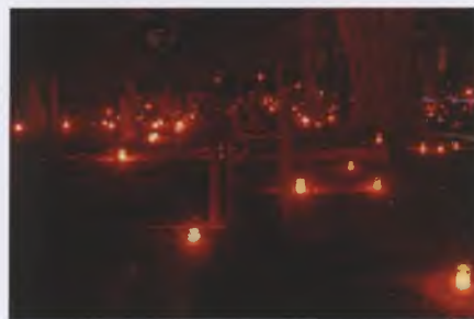
Bovenstaande foto van ons lid Pieter Harbering geeft een mooie impressie van deze lichtjesavond.

12 februari 2022 Filmvoorstelling in De Stoomhal in Wormer (onder voorbehoud)