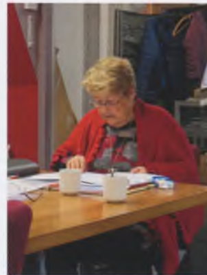
Diet List - Hilderling - Het praatje gaat weer