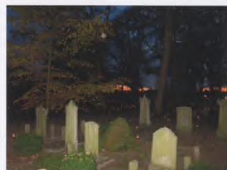
2000 lichtjes verlichten de Oude Begraafplaats tijdens de Lichtjesavond

Al vroeg in de ochtend van 3 november kwam de harde kern vrijwilligers bij elkaar om de 2.000 waxinelichtjes in de daarvoor bestemde potjes te plaatsen en over de begraafplaats te verspreiden. 's Middags om vijf uur was men weer present om de lichtjes aan te steken. Dit verliep echter niet geheel vlekkeloos. Veel lichtjes waren in de tussentijd namelijk uit de potjes verwijderd en lagen her en der op de grond. Ook waren diverse potjes gebroken. In eerste instantie werd gedacht aan een misplaatste grap, maar al snel werd duidelijk dat de eksters, die op de begraafplaats verblijven, de boosdoeners waren. Ze zijn immers gek op glimmende voorwerpen! Het was als vanouds een zeer geslaagde avond, waarbij de leerlingen van de Openbare Basisschool De Pionier de hoofdrol speelden met het voorlezen van hun gedichten over de begraafplaats. Er zaten weer mooie exemplaren bij. De muzikale omlijsting kwam van het gelegenheidskoor onder leiding van Marjoke Keek. Met dank aan alle vrijwilligers die deze lichtjesavond weer mogelijk hebben gemaakt. Enige dagen later ontvingen wij van Pieter Harbering een e-mail, met daarbij een link van een door hem gemaakte fotoserie over deze lichtjesavond. Hartelijk bedankt Pieter