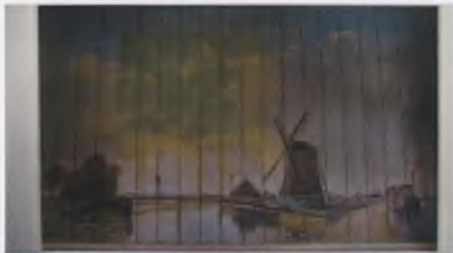
Molen Het Leven - schildering in De Knapzak

door. Gelukkig waren de weergoden ons op 22 oktober gunstiger gezind en vertrok onze gids Dick Zwart rond 10.30 uur vanuit het Veerhuis onder het 'genot' van af en toe een regenbuitje met een groep enthousiaste wandelaars door Wormerveer-Noord. Als extraatje kon men in De Knapzak aan het Noordeinde 18 een kijkje nemen. Piet Eikel, eigenaar van deze zaak, had spontaan aangeboden zijn winkel ter gelegenheid van de wandeling open te stellen. De tijdens een verbouwing tevoorschijn gekomen schildering in genoemd pand van de molen Het Leven oogstte veel bewondering. Wist u trouwens, dat hier tot 1824 het gemeentehuis van Wormerveer was gevestigd? Het werd een interessante tocht door het verleden. Bedankt Dick voor je inzet