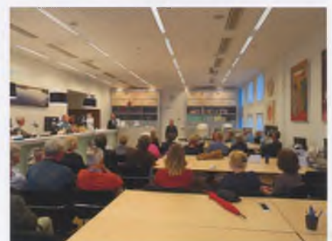
Jaap Klomp vertelt enthousiast over schilder Willem van Leyden

uitgenodigd een en ander te vertellen over de maker van deze aquarellen. Jaap wist de aanwezige nazaten regelmatig te verrassen met nieuwe informatie over hun familielid.