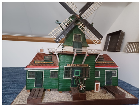
Modelmolen De Zaanstroom

augustus jl. kwam de molen naar Wormerveer. Hij staat voorlopig in de etalage bij AlphaBed, wachtend op een geschikte locatie. De molen is 88 cm breed, 60 cm diep en 90 cm hoog. Hebt u suggesties voor een locatie, laat mij het weten. In De Zaanstroom zelf is helaas geen ruimte beschikbaar.