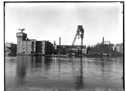
Zaandijkerweg met Zeepziederij de Adelaar 1920

Behalve een jubileumboek brengt de HVW dit jaar een kalender uit met zwart/wit foto's van Wormerveer en een foto van Westknollendam. Deze uitgave wordt mogelijk gemaakt door Johan Duinmeijer, die het voorstel voor een kalender bij het bestuur neerlegde en hierbij vermeldde de hieraan verbonden kosten voor zijn rekening te zullen nemen. De kalender zal als alles volgens plan verloopt op 2 september a.s. tijdens de festiviteit 'Tegendraads uit de Bocht' (langs de Zaanweg) aangeboden worden voor de prijs van € 5.