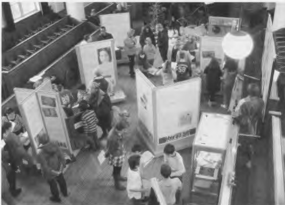
De HVW tentoonstelling 'Dichter bij 4 mei' in november 2011

De HVW tentoonstelling 'Dichter bij 4 mei' is opgenomen in het Zaanse Cultuurmenu, wat betekent dat scholieren uit de twee hoogste klassen van het Zaanse basisonderwijs, om de twee jaar deze tentoonstelling kunnen bezoeken. Het cultuurmenu is een bundeling van een groot aantal kunst- en erfgoedprojecten die via een brochure aan alle basisscholen in de regio worden aangeboden. Aan de hand van dit aanbod maken de verschillende scholen een keuze welke projecten bezocht kunnen worden. Uit de opname van 'Dichter bij 4 mei' in het menu blijkt dat de tentoonstelling zeer gewaardeerd is door de bezoekende scholen medio november vorig jaar. Concreet betekent een en ander dat de tentoonstelling elke twee jaar wordt gehouden gedurende de maand april, voor het eerst in 2012.