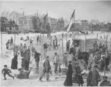
Wintervermaak op de Zaan bij Wormerveer rond 1900, een van de fraaie prenten van de kalender die de HVW vanaf september uitgeeft.

In 2008 gaf de HVW een prachtige kalender uit met prenten van Arnold de Lange die op treffende wijze oud Wormerveer weergaven. Dankzij de medewerking van een aantal Wormerveerse ondernemingen lukte het om deze uitgave te realiseren en wel op een zodanige wijze dat de HVW er de clubkas flink mee kon spekken. Gelet op dit succes brengt de HVW dit najaar opnieuw een kalender uit, nu voor het jaar 2012. Arnold de Lange maakt weer een serie mooie aquarellen van oud Wormerveer die als afbeeldingen deze kalender zullen sieren. Dankzij opnieuw de medewerking van een flink aantal Wormerveerse ondernemingen is dit kostbare project weer mogelijk. Meer nieuws over deze bijzondere uitgave leest u in de volgende Nieuwsbrief.