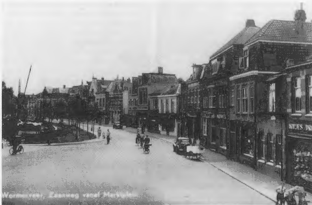
Voor de zoveelste maal is een deel van de Zaanweg recent op de schop gegaan. Een fraai beeld uit de jaren '50 toont de situatie, gezien vanaf het balkon van De Jonge Prins.

Me dunkt, die woorden zijn gelogenstraft, want met een ledental van bijna 1000 behoren we tot de grootste historische verenigingen en genootschappen van ons land. Iets om trots op te zijn. Nog iets om trots op te zijn, is de wijze waarop de HVW zich presenteert en welke activiteiten er allemaal door de vereniging worden ontplooid. Via de werkgroepen worden alle mogelijkheden benut om de rijke geschiedenis van ons dorp te onderzoeken en openbaar te maken. Ons periodiek Wormerveer Weleer wordt in brede kring gewaardeerd terwijl de adoptie van de Oude Begraafplaats de vereniging veel goodwill oplevert. De tentoonstellingen en Jaardagen worden goed bezocht terwijl er inmiddels een omvangrijk archief is opgebouwd uit de niet aflatende stroom schenkingen. Met veel oudere Wormerveerders zijn interviews gehouden terwijl de fraaie HVW website steeds vaker, wereldwijd, bezocht wordt. Toch blijft ook de HVW een mensenorganisatie wat betekent dat er fouten gemaakt worden. Andersom: van fouten leert men waardoor de vereniging in staat moet zijn te kunnen blijven groeien, niet alleen qua ledental, maar ook qua structuur en organisatie.