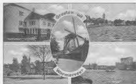
Groeten uit Wormerveer 2

Tijdens de voorjaarsbraderie op zaterdag 4 juni zal op de HVW kraam het tweede boekje uit de reeks 'Groeten uit Wormerveer' worden gepresenteerd en te koop aangeboden. Opnieuw zal het boekje veel herinneringen oproepen bij (oud) Wormerveerders middels de tientallen afgebeelde foto's. De prijs van het boekje zal wederom € 15,- bedragen.