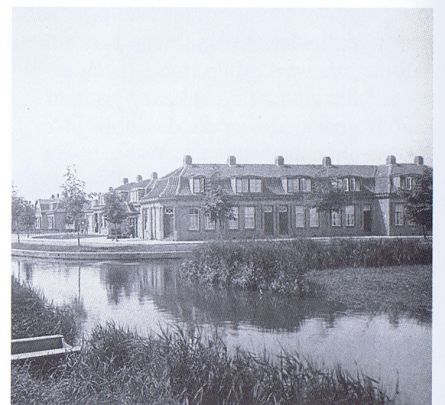
De oudste bebouwing van de Zeeheldenbuurt ofwel de Blauwe Meelbuurt?