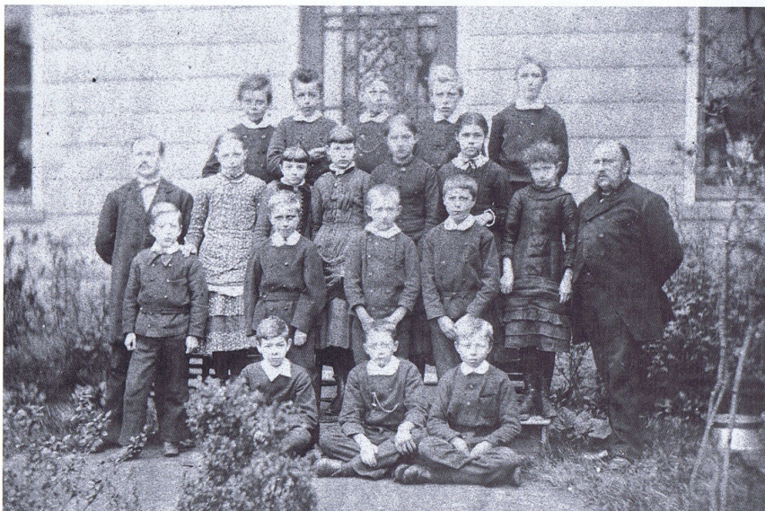
De Fransche School aan de Marktstraat plm. 1880.

Op basis van de nationale collectie verpakkingsblik in het Historisch Museum Deventer (expositie 6 maart t/m 19 september 2010) biedt dit boek een interessant overzicht van de geschiedenis van de blikindustrie in Nederland (o.a. Verblifa, Krommenie). Het boek behandelt met name de geschiedenis van de vormgeving van het verpakkingsblik in relatie tot maatschappelijke ontwikkelingen in Nederland sedert de afgelopen 150 jaar.