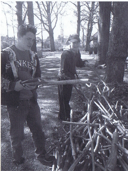
De twee deelnemers aan de maatschappelijke stage op de Oude Begraafplaats.

Afgelopen voorjaar werd een maatschappelijke stage uitgevoerd door leerlingen van het TRIAS VMBO. Op de begraafplaats verrichtten enkele jongens werkzaamheden waarbij ze begeleid werden door HVW vrijwilligers. Andere leerlingen hielden zich bezig met oudere Molukkers op het gebied van contact leggen en – vernieuwen. Beide projecten werden door alle partijen als zeer bevredigend en voor herhaling vatbaar ervaren. Wellicht zal dus ook volgend schooljaar door leerlingen van het voortgezet onderwijs een stage vervuld worden bij de HVW.