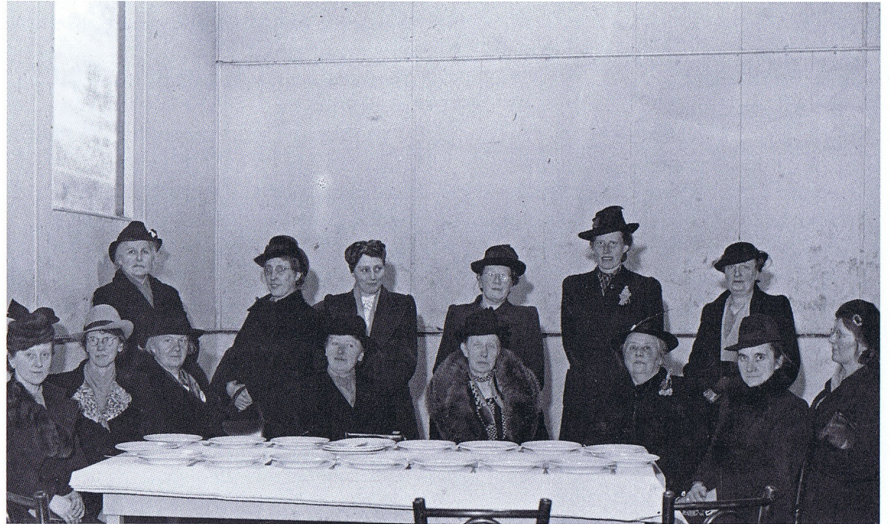
De tijdens de oorlog ingestelde Wormerveerse gaarkeuken werd bestuurd door deze notabele dames.

Met de overname van de vermaning nam de beheersstichting niet alleen de lusten van dit fraaie gebouw over, maar ook de lasten. De SWV staat voor de uitdaging om funderingsherstel onder de achtergelegen kerkenraadskamer te realiseren en deze ruimte tevens geschikt te