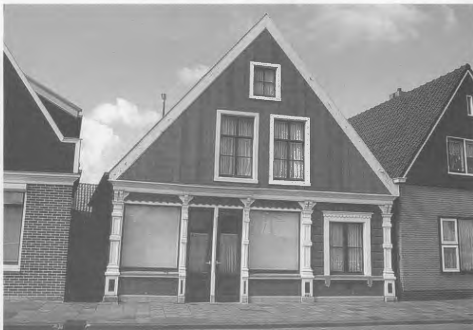
slijterij Siekerman, Noordeinde 9.

De werkgroep heeft protest aangetekend tegen de voorgenomen sloop van een drietal villa's aan de Wandelweg. Er is een aanvraag gedaan om Noordeinde 9