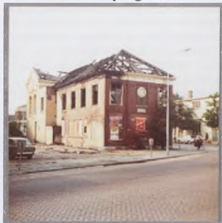
de klok aan de gevel na de brand

U herinnert zich vast nog wel de brand op 6 maart 1975, die het voormalig gemeentehuis van Wormerveer grotendeels in de as legde. Een foto vlak na de brand genomen, toont de klok aan de Zaanzijde-gevel.