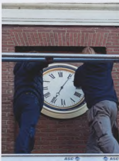
de klok wordt aan de huidige gevel geplaatst

enberg, Nooij Maatmeubels, Saenkanter Fashion BV, juwelier Frans Kuyper, Gezond Plus, Huisartsenpraktijk Wormerveer en de eigenaar van het pand, hangt de klok vanaf 3 december vorig jaar weer op zijn plek. Het heeft de nodige tijd gekost, maar daar is het dan ook een klok voor! Zowel ZaanTV als TV-Noord-Holland schonken hier aandacht aan. Een mooie PR voor onze vereniging.